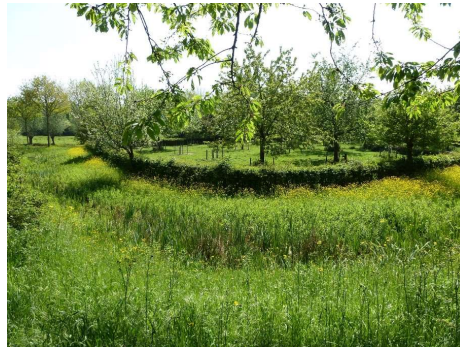
De groene long in Kuurne